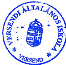
Pál Ottó igazgató